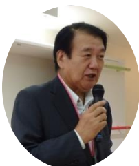
(伊藤本部長 ごあいさつ)