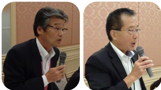
(本部 青野事務局長より説明)

2日間お疲れ様でした。 東海電電旧友会の皆様にご参加 いただき、大変有意義な2日間 でした。有難うございました。