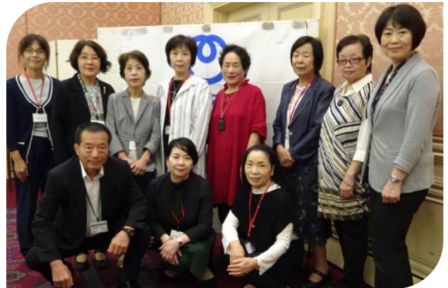
(東海地方本部の皆様)