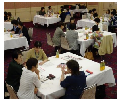
(グループディスカッション模様)