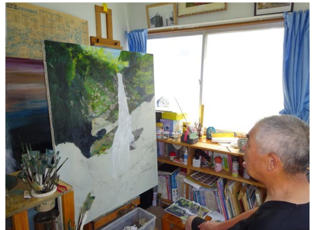
写真;自宅アトリエ

今年も秋には、「福島県美術協会展」（過去に入選の経験あり）と「福島県シルバー美術展」がありますので、現在出展作品（50号）の制作中ですが連日の暑さで、なかなか制作のピッチが上がらず苦勞しています。